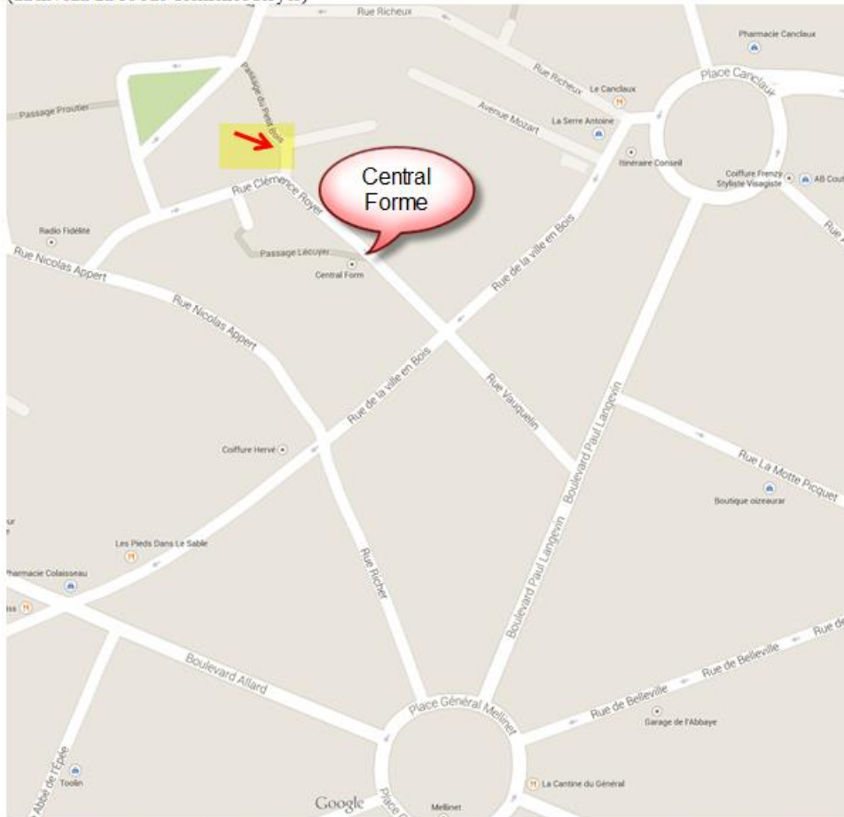
Salle-Atelier de Sculpture Française Boudier , 1 impasse des Armateurs (au niveau du 18 rue Clémence Royer)